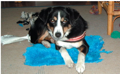
Findelhund «Luna» hat sich die weiche Decke gleich unter die Pfoten gerissen.

Für alle sechs Verzichtshunde konnte bei Tierfreunden einen neuen Platz gefunden werden.