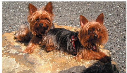
Verzichtshunde «Cici» und «Bubi» sonnen sich gerne auf dem Stein.